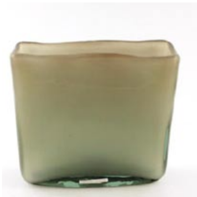
Vaso Square 19 x 20 x 5 25 x 20 x 8