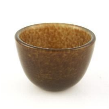
Bowl h8.5 x d12.5