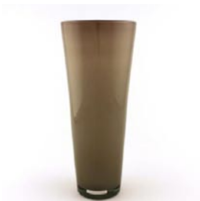
Vaso Limo h31 x d12 h21 x d12