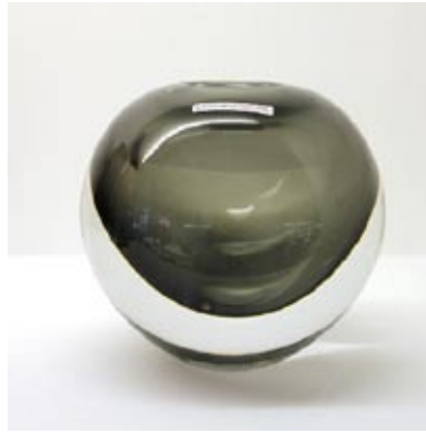
Vaso Ball hoch rund