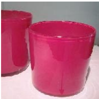
Vase Alex, rot - h26 d28 - h35 d29