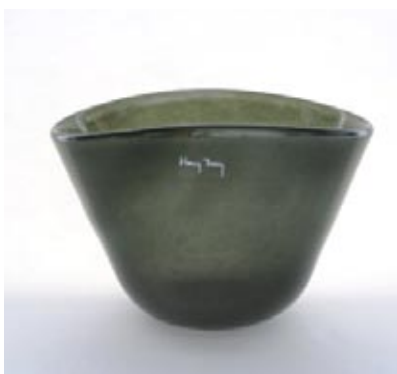
Vaso Mercer h15 d 20 h20 x d25