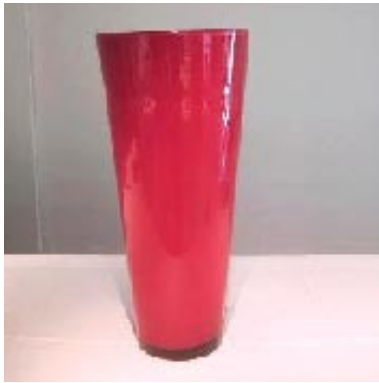
Vase Alex - rot, h65 d30 - weiss, h65 d30 - rot, h45 d25

Das hochwertige, mundgeblasene Glas wird hergestellt in Glashütten in Belgien, Frankreich und der Tschechei. Das spezielle an den Gläsern ist die Farbe, welche in das Glas ‚gedreht‘ wird.