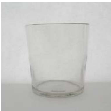
Klarglas, mittlere und grössere Formen