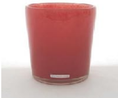
Belle Isis h16 d15, diverse Farben