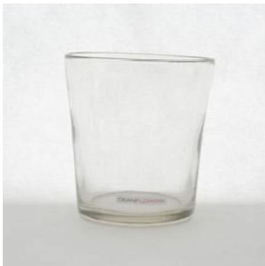
Klarglas, kleine und mittlere Formen