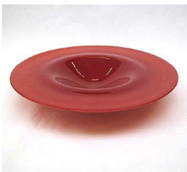
Schale Peru, blood